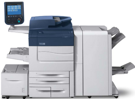
Xerox Colour C60/C70 Printer